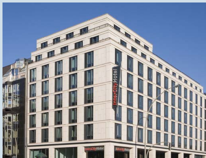
Bild: Hotel-Objekt in Hamburg, Glockengießerwall „InterCity Hotel“

Die Union Investment Institutional Property GmbH (vormals DEFO-Deutsche Fonds für Immobilienvermögen GmbH) tritt seit über drei Jahrzehnten als Fonds- und Immobilienmanagerin in Deutschland und Europa auf. Bei Investoren, Mietern und Marktpartnern hat sich die Gesellschaft als qualifizierter Ansprechpartner einen sehr guten Namen gemacht. Hauptgesellschafter ist die Union Asset Management Holding AG; Die Union Investment Institutional Property GmbH ist damit Schwester-gesellschaft der Union Investment Real Estate GmbH.