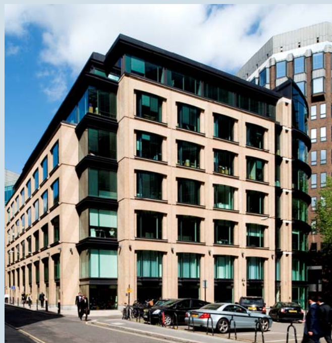
Bild: Objekt des DEFO-Immobilienfonds 1 in UK, London, 1 Plough Place

Immobilienangebote aus osteuropäischen Ländern werden ebenfalls sorgfältig geprüft. Anfragen richten Sie bitte unter 040/34 919-4172 an Herrn Matthias Gerloff.